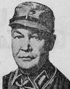
General VON ARNIM, taken prisoner in North Africa

It is the hope of these struggling workers that another effort will be made by the powers that be to afford them some appreciable relief.