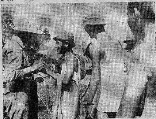
Soldados japoneses capturados por las tropas norteamericanas en el frente del Pacífico suroeste, reciben cuidados médicos en un campamento de prisioneros.