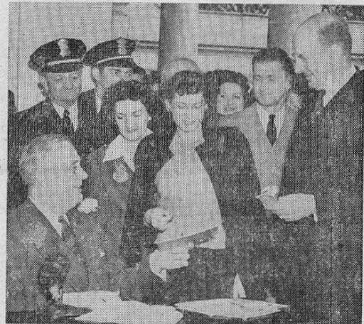
El presidente Roosevelt abre en la Casa Blanca la campaña que se acaba de iniciar en los Estados Unidos en pro de un empréstito bélico de trece mil millones de dólares. A la extrema derecha, el secretario del Tesoro, Henry Morgenthau.

WASHINGTON.—Los ciudadanos de los Estados Unidos, desde los más altos funcionarios del Estado hasta los pobres jornaleros que se pierden en la multitud, no han escatimado en nada su ayuda más desinteresada para asegurar el éxito de la reciente emisión de Bonos de Guerra por valor de $13,000,000,000, cantidad que se empleará para asestar nuevos y aplastantes golpes contra las naciones del Eje.