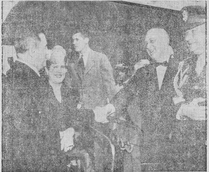
El Sr. Don Manuel Avila Camacho, Presidente de México, mostrado a Monterrey, México, en el momento en que saluda al Presidente de los Estados Unidos, Sr. Franklin D. Roosevelt cuando él llega allí por una conferencia histórica. La Señora esposa del Presidente de México se mira en el centro.