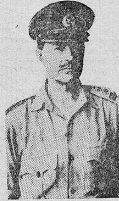
General Sir H. A. Alexander, of the Allied Forces in Tunisia

have so affected the Nazis that they will be unable to initiate their threatened spring offensive.