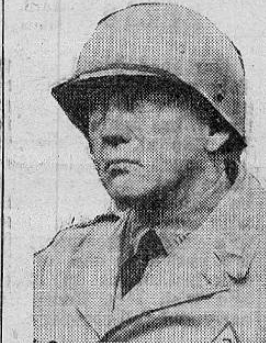
General PATTON who Commanded North American Forces in Tunisia